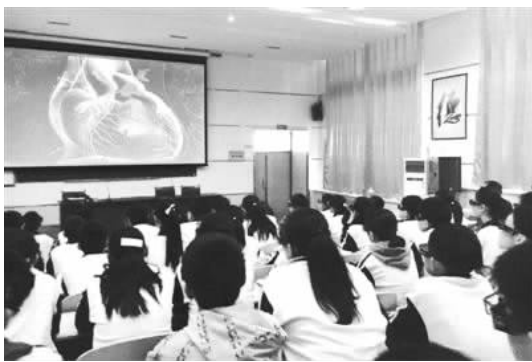
图2 学生在生物课上观看3D视频教学课件 (二)3D数字化教学资源建设存在的问题

名学生可以将课程内容完整地复述出来,而2D班的25名学生只有17名可以复述出来 [10] 。虽然之前的研究都表明,3D技术应用于教学是有益处的,但是在香港,3D应用于教学还存在一定的困难,很多学生因为近视的原因,在观看3D的时候需要佩戴两副眼镜。此外,国内实施了“绿色班班通”3D教学实验项目 [11] ,建设了专门用于3D教学的未来教室,配置了3D投影机及其相关的3D设备,通过呈现3D影像等数字化教学资源,为学生创建出逼真、高沉浸感的学习环境,为学生带来了丰富的学习体验。自2012年元旦开始,中国首个3D电视试验频道开始播出。3D频道播出节目内容包括体育、动漫、专题、综艺类节目以及大型的实况转播,具有体验时尚及身临其境的视觉感受 [12] 。2016年11月1日,山东省威海市皇冠中学将3D立体显示技术引入课堂,将其应用到生物、物理、化学等学科的教学,以提升学生的学习兴趣,提高教学质量 [13] 。如图2所示,学生在生物课上观看3D视频教学课件。在传统课堂教学中,教师通常使用二维图形来解释三维空间的概念,学生很难作形象地理解;而3D数字化教学资源能把讲解的知识内容立体显示化,而且通过向学生展示逼真的3D内容,使之获得沉浸式的体验,能够帮助学生迅速理解知识,对于提升未来课堂教学效果大有裨益。