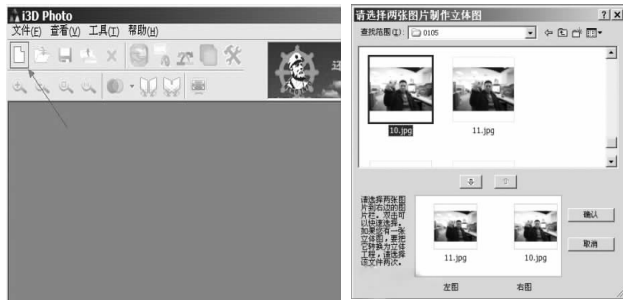
图3 软件“i3D Photo”截图