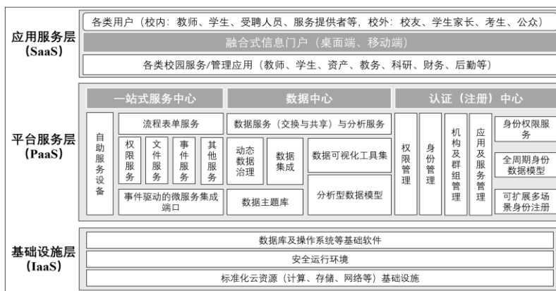
图 1 基于云计算的智慧校园基础平台总体架构

基于云计算的智慧校园基础平台总体架构采用标准的云计算三层架构，如图 1 所示。需要说明的是，应用服务层除了提供应用服务，还通过融合式信息门户的建设，打通桌面端和移动端，形成一系列校园应用在访问入口和交互界面方面的标准。