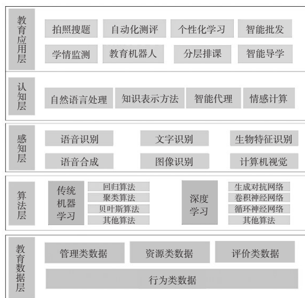
图1 教育人工智能的技术框架

人工智能的发展经历过三次浪潮，分别是计算智能时代、感知智能时代和认知智能时代，人工智能教育应用伴随这三类智能技术的发展而不断发展。吴永和等认为，“人工智能+教育”的相关技术有机器学习、深度学习、自然语言处理、神经网络、学习计算、图像识别等（吴永和等，2017）；闫志明等指出，教育人工智能的关键技术主要有知识