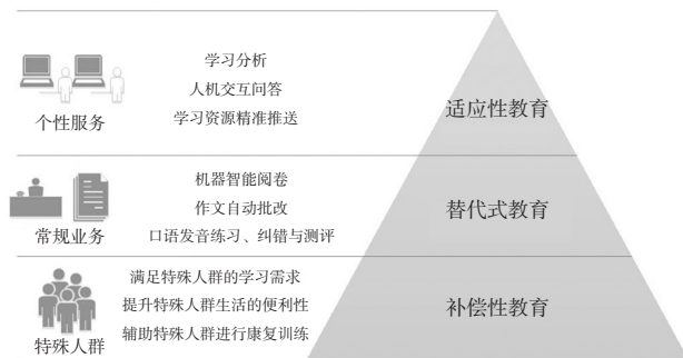
图2 教育人工智能三层次应用模式

教育人工智能的应用核心应聚焦教育目标和价值体系，利用人工智能技术的优势与教育过程相融合，以产生1+1>2的效果（张坤颖等，2017）。根据目前人工智能技术的特点和优势，本研究认为人工智能可以解决三个层面的教育问题，分别是面向特